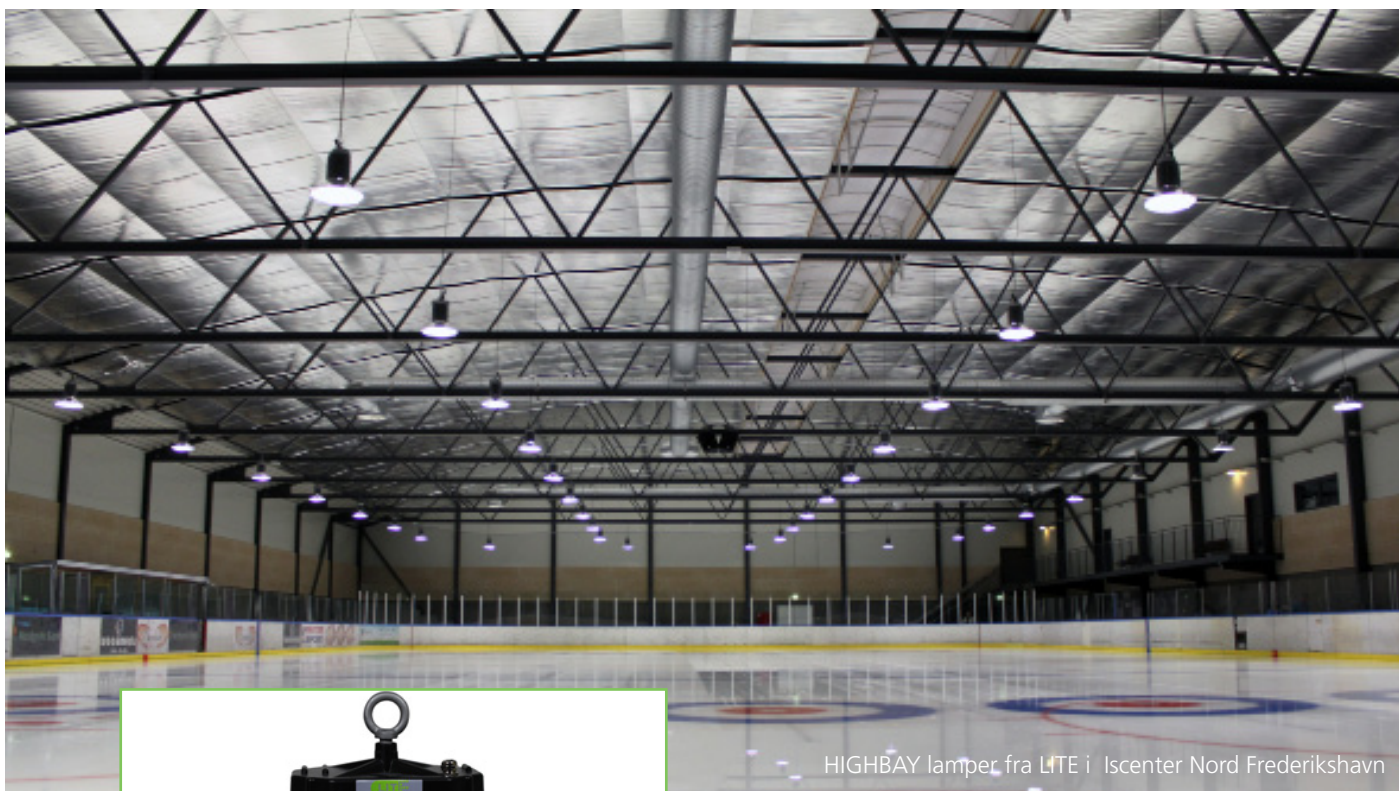
HIGHBAY lamper fra LITE i Iscenter Nord Frederikshavn